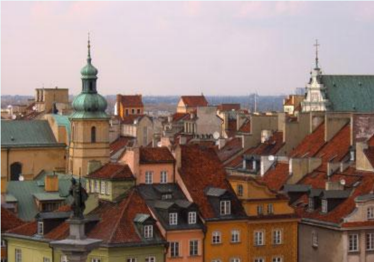
Varsavia, Via Reale